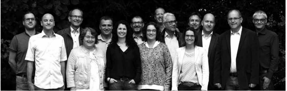
Behörde Sekundarschule Weinfelden, Schulleiter und Schulsekretär (von links nach rechts)

Die Sekundarschulbehörde hat sich im Jahr 2019 wiederum mit sehr vielen Aufgaben befasst. Sie bearbeitete die Geschäfte an 11 Sitzungen. Zwei dieser Sitzungen wurden als Seminare mit jeweils zwei Halbtagen durchgeführt. Die Geschäftsleitung führte 16 Sitzungen durch. Die Schulleiter bearbeiteten eigene Themen und Aufträge der Behörde oder aus der Geschäftsleitung in den Schulleitersitzungen. 2019 waren es 13 Besprechungen. Dadurch wurden die Geschäftsleitung und die Behörde entlastet. Zudem wurden in verschiedenen Kommissionen Arbeiten erledigt und Anträge zuhanden der Behörde vorbereitet.